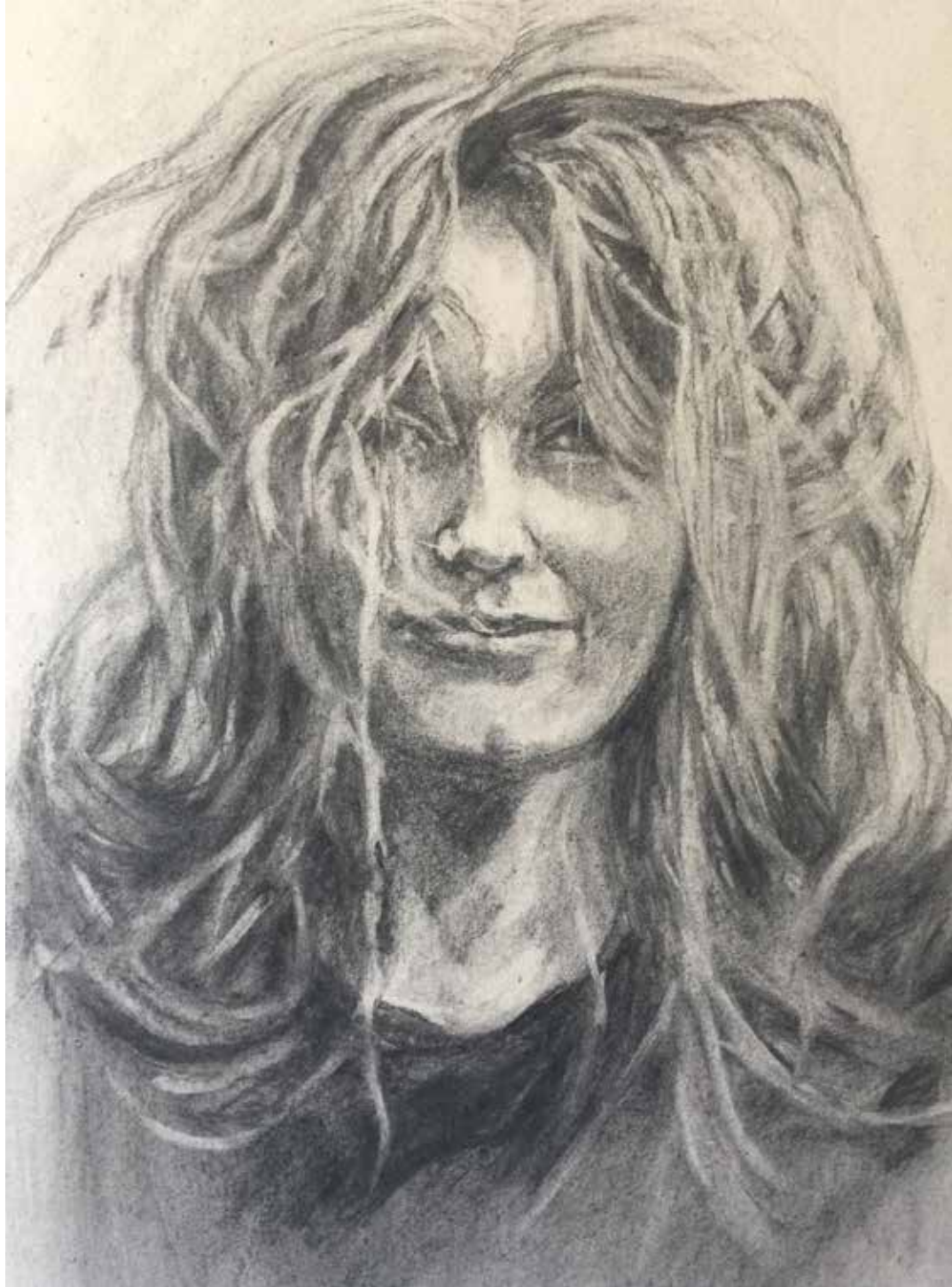
Anke Wijnia, Anna-Seaske , 2020, houtskool op papier, 40 x 50 cm.